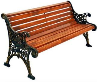
7. Декоративні лави