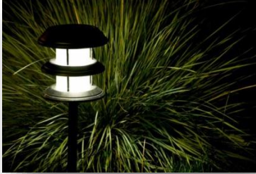
8. Ліхтарі для клумб від сонячної енергії