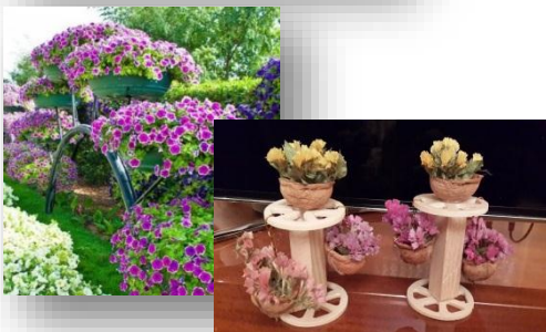
5. Квітники з петуній