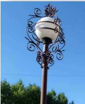
9. Вуличні ліхтарі