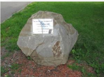
12. Камінь з написом: « Хто не знає свого минулого, той не вартий майбутнього »