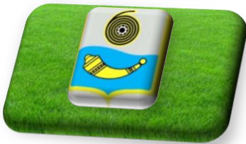
10. Герб Шостки